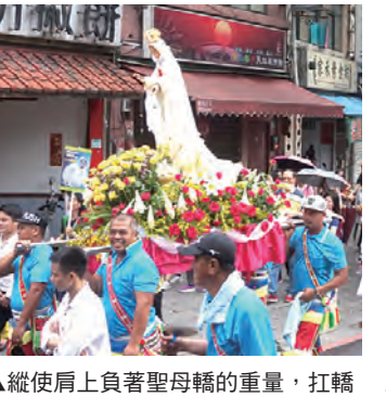
▲縱使肩負著聖母轎的重量，扛轎的弟兄們仍深感光榮，微笑前行。