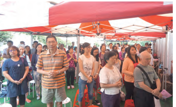
▲聖堂外搭了棚架區，提供教友們同步參與感恩聖祭。