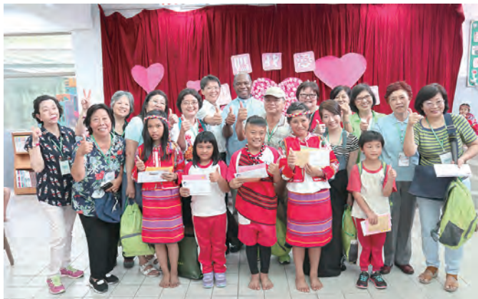
▲永和天主堂的7組護苗天使與他們所關懷的幼苗小天使合影。