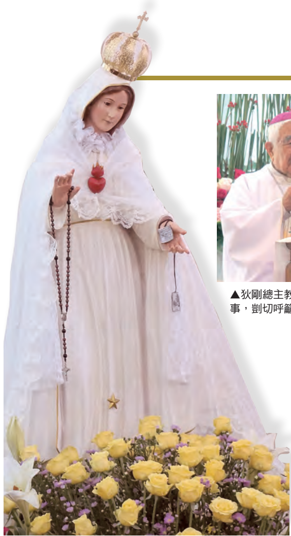
▲聖母聖心慈愛垂視，護我台灣教會。