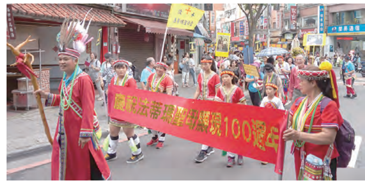
▲原住民教友們在遊行隊伍打頭陣，小朋友絲毫不喊苦怕累。

至今並未改變，我們仍然需要不斷地祈禱、克己、補贖，來面對自己的過犯，時時醒寤自省；世人的自私與冷漠，導致的戰亂與貧窮，是世界的混亂痛苦之源，聖母祈望世人以自身的覺醒與改變，為世界帶來和平；在葡國法蒂瑪聖母的皇冠裡，至今仍留有那枚子彈，就是她傳達給牧童的秘密在日後被一一印證的標記；憂國憂民的狄剛總主教也在講道中與時局政事結合，呼籲我們多為政府領導團隊祈禱，現今最重要的是注重婚姻家庭，將好的家庭教育扎根於信仰中，孩子們能在愛的環境中成長，我們應追求的也不是財富名利，而是精神層次的提升，台灣想在國際上佔有一席之地，可惜，我們所擁有的，卻是離婚率及墮胎率是全世界第一，生育率更是低到了大大影響國力，唯有以良好的婚家庭作奠基，國家才有希望；他大聲疾呼領導者的前瞻目光應注視於人民真正的需要，我們的心靈建設及道德重整，這比建設使用率不高卻花費不貲的交通建設重要得多，我們要在祈禱中懷抱希望，讓聖母的殷殷叮嚀帶領我們心靈有所歸依，國家安泰，世界和平。