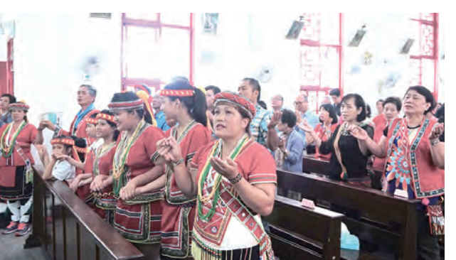
▲原住民教友們參與重要慶典，穿著傳統盛裝，十分醒目。