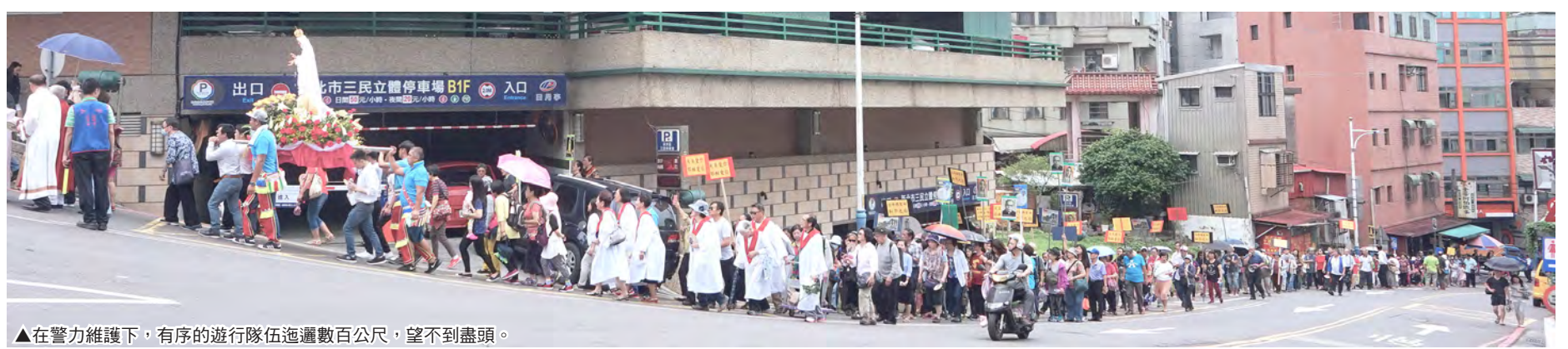
▲在警力維護下，有序的遊行隊伍邁過數百公尺，望不到盡頭。 ▲不同國籍的神父們同心合意地共祭，朝聖彌撒溫馨感人。

淡水法蒂瑪聖母朝聖地是個很有歷史的老教堂，位於新北市淡水區中山路139號，環境幽雅、花木扶疏。由林茂才神父於1906年建堂，1949年，高師謙神父奉法蒂瑪聖母為本堂主保，後於1950年10月12日由台北總教區核定為朝聖地。現有的聖堂於1961年由丁逸民神父新建，新聖堂落成時，成世光主教主禮祝聖聖堂典禮，並由田耕莘樞機舉行落成感恩彌撒。