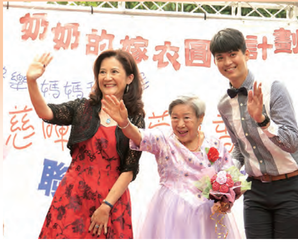
▲住民奶奶一身優雅禮服，手捧花束，上台走秀，人比花嬌。