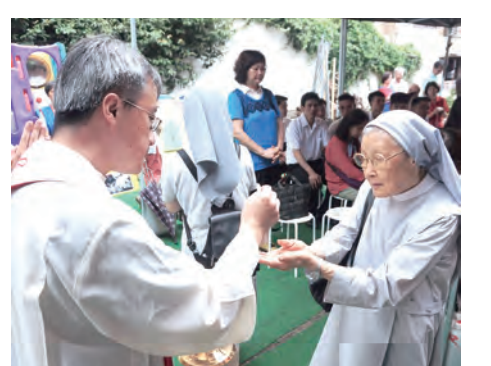
▲聖堂外的棚架區，領聖體的動線也有條不紊。