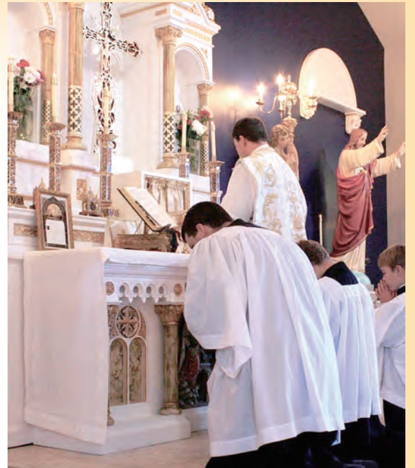
▲禮儀的行動是參與基督的救贖工程，默想神聖的奧蹟。

該是聽從大公會議的時候了！禮儀「主要是為敬禮至尊的天主」（第33號）。當禮儀完全朝向光榮天主及對天主的敬禮時，就具有教育的價值。禮儀讓我們真實置身於天主超越性的臨在中。真正的參與，意味著在我們內更新聖教宗若望保祿二世曾很重視的這個「奇異感」（《活於感恩祭的教會》，第6號）。這個面對天主神性尊威的神聖奇異感，這個喜樂的敬畏之情，需要我們靜默以對。我們總是忘記《神聖的靜默》是大公會所指出，為促進參與禮儀的條件之一。如果禮儀是基督的工程，主禮需要在禮儀中加入自己的解說嗎？我們要記得，當彌撒經書允許一個附加的解釋說明，這不該成為一個世俗、人為的演說，不該是關於對時事的評論，或是向在場信友俗套的問候，而應是以非常簡潔的方式勸勉大家進入奧蹟（參閱《羅馬彌撒經書總論》第50號）。至於講道，本身是一個禮儀行為，有其該遵守的規則。主動參與基督的工程的前提是，拋開世俗的世界，為能進入「最卓越的神聖行為」（第7號）。事實上，「我們難道可以驕傲地認為，停留在人性的層次，就可以進入到神聖的奧秘中嗎？」（薩拉，《天主或虛無》，第178頁）以此看來，若教堂不能被視為神聖敬禮的場所，人們以不得體的衣著進入聖堂，好像是一個神聖空間沒有因建築的不同而明顯區別開來，這個現象是令人遺憾的。再者，大公會議教導，宣讀聖言時，基督就臨在其中；讀經員所宣讀的不是人的話語而是天主的聖言，但若穿著不得體，也同樣有危害。