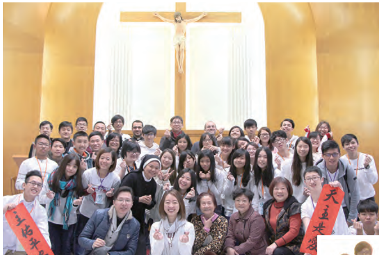
▲支持青年的神父修女叔叔阿姨們，在接受訪問之後，與我們一起合影，並為我們暑假的夏令營加油打氣。

彌撒後，你是否也是來匆匆去匆匆？對於身邊的教友有多少了解？或許常常看見有些教友很熱心，或者覺得有些教友靈修深厚、為教會付出奉獻？就如「人子來不是受服事，而是服事人，並交出自己的生命，為大眾作贖價。」（瑪20:28）今日教會能夠如此龐大，正是有許多人在為大家付出。