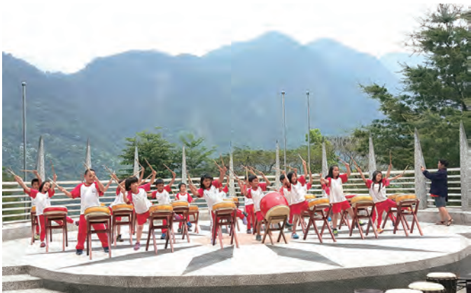
▲互助國小校慶由精彩的擊鼓表演展開序幕。

傳愛行程圓滿結束，每位參與的教友，內心都有不同的看見；每一張天真可愛的小小臉龐，也寫滿了對未來人生的渴望。對教友來說，看見自己的關懷落實在這些孩子身上，是一種付出的感動；對孩子而言，這段彼此生命交會的美好過程，將教導他們在日後懂得什麼是「愛與分享」。高福南神父也勉勵教友們將「護苗」的種子擴散到社區、到國高中、甚至大學……。他並引聖言：「聖神如風」（若3:8），風從哪裡來，往哪裡走，我們並不知道，但在聖神的帶領下，「護苗」工作將會如風揚起，不會止息。