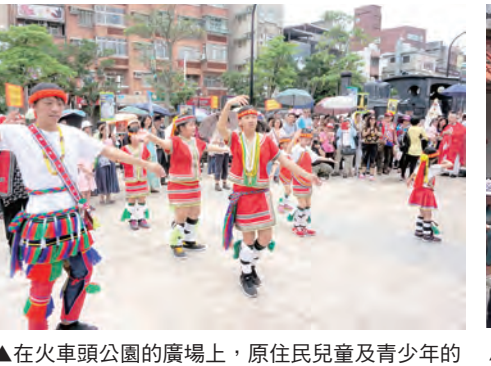
▲在火車頭公園的廣場上，原住民兒童及青少年的載歌載舞，使遊行更添歡慶氣氛。

全體以〈信經〉再次堅定信德後，在信友禱詞中再度以法蒂瑪聖母的劃切提醒為祈禱意向，誠心誠意懇求天主俯聽我們的祈禱；早已準備妥當的奉獻隊伍，穿著原民傳統服飾，在悠揚歌聲中走向主台前，呈獻給天主全體教友們所投入的祈禱意向、獻儀、香燭、鮮花、壽桃與餅酒；聖堂樓上樓下及聖堂外搭建棚架下的教友一起虔誠參與聖祭禮儀，人數雖然眾多，但在事先演練好的規畫動線中，大家都能依序領聖體，感受到彼此是主內肢體，共融於基督奧體中。