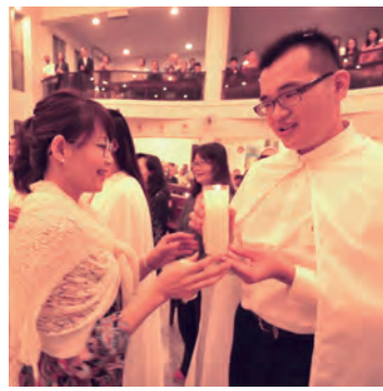
▲從代母手中接受基督之光