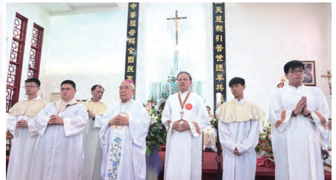
▲為數眾多的輔祭群，顯示堂區青年的蓬勃活力。