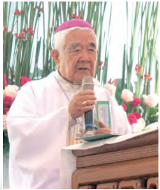
▲狄剛總主教的講道，結合時事，劃切呼籲基督徒的作為。