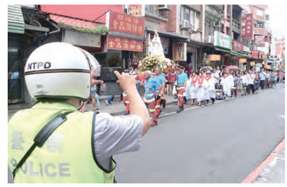
▲辛勞的警察維安開道，忍不住也拍照留住這珍貴景象。