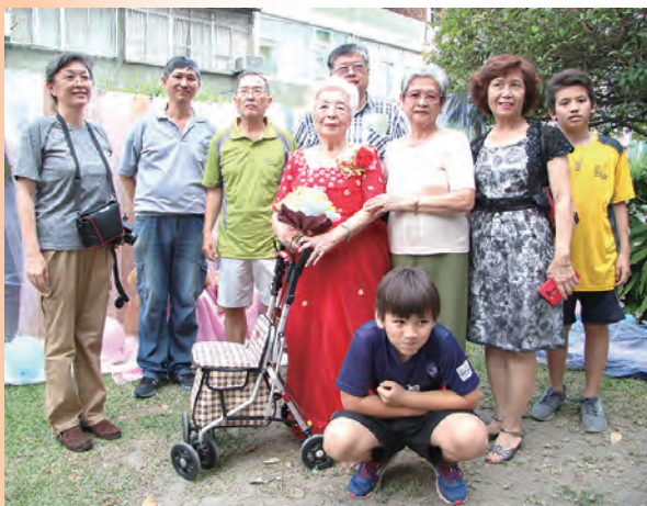
▲兒孫同來和奶奶歡度母親節，欣賞奶奶的嫁衣秀。

感謝潘志鵬和蔡永登兩位攝影老師為奶奶們留下美麗的身影，以及文藻外語學院黃德芳老師帶領同學的服務，謝謝各界的協助與支持。最後特別感謝在「孝愛」我們有一群自己放棄當媽媽的機會，選擇終身奉獻照顧更多人，他們將小愛換成大愛，在這時刻感謝天主、謝謝老姆姆和修女們。此次圓滿畫下休止符，活動後，很多長者及家屬不斷表達感謝之意，參加一場難忘又充滿意義的母親節。