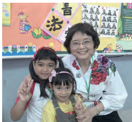
▲護苗天使與幼苗小天使相見歡。

懷的學童相見，一種彷彿存在已久的默契，消除了彼此的尷尬與陌生。大人與孩子們親切地互換卡片、話家常，一位姊妹拿出禮物袋中的髮飾為孩子綁上美麗的馬尾，可愛的小天使眨著骨碌碌的大眼睛微笑回應，還不忘把禮物分給妹妹一份；帶領同學表演歌舞、活潑好動的小男孩，露出雪白牙齒，興奮地對著他的大天使訴說長大要當軍人的夢想；頭髮剪得像男生的小二女孩，看不懂卡片上的字，於是她的大天使一字一句慢