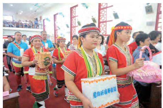
▲獻祈禱意向、香燭、壽桃、鮮花、獻儀與餅酒於主台前。

淡水法蒂瑪聖母朝聖地是個很有歷史的老教堂，位於新北市淡水區中山路139號，環境幽雅、花木扶疏。由林茂才神父於1906年建堂，1949年，高師謙神父奉法蒂瑪聖母為本堂主保，後於1950年10月12日由台北總教區核定為朝聖地。現有的聖堂於1961年由丁逸民神父新建，新聖堂落成時，成世光主教主禮祝聖聖堂典禮，並由田耕莘樞機舉行落成感恩彌撒。