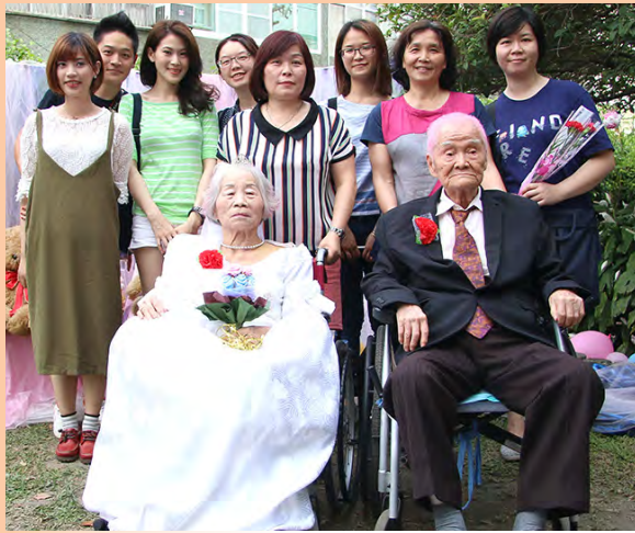
▲孝愛仁愛之家的資深住民爺爺奶奶與兒孫的和樂全家福