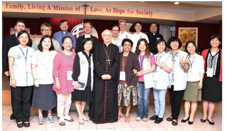
▲世界主教會議秘書長巴爾蒂斯利樞機主教（前排中），與參加2017年東亞家庭會議的成員開誠交流。 ▲世界主教會議秘書長巴爾蒂斯利樞機主教偕同台灣教會的神長、修女及平信徒，在感恩聖祭中領受家庭之愛的喜樂。