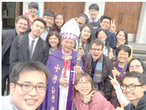
▲甄選禮與洪總主教的自拍照