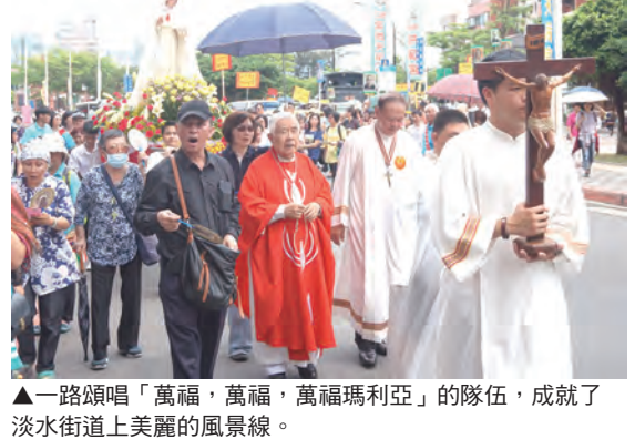
▲一路頌唱「萬福，萬福，萬福瑪利亞」的隊伍，成就了淡水街道上美麗的風景線。