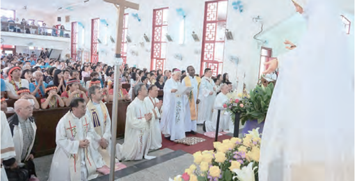
▲狄總主教帶領全體恭誦〈奉獻法蒂瑪聖母禱詞〉。

淡水是個台灣少數幾個人口持續在增加的城市，從70年代的幾萬人，發展到現今的20多萬人，估計在未來10年，隨著淡水新市鎮的發展，人口會增加到30萬人，因為淡水新市鎮的規畫完整，房價低，外來人口主要是高教育水平的退休人員和年青夫婦，這逐漸改變了淡水的人口結構，對於福傳工作也是一個新的挑戰。