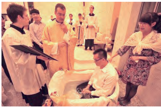
▲以浸洗式進行洗禮