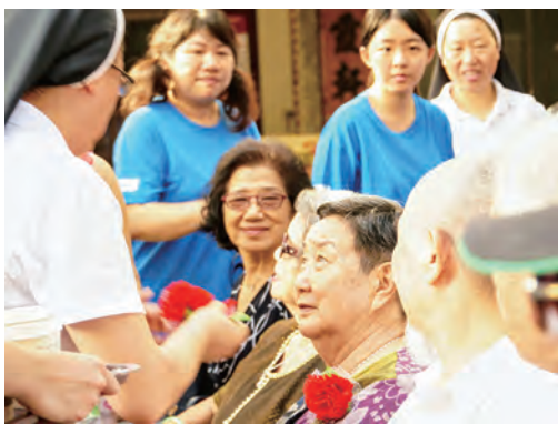
▲為每一位為人母親者別上胸花，表達孝愛仁愛。 ▶每位奶奶穿上禮服，加上亮麗的梳妝，美上加美。