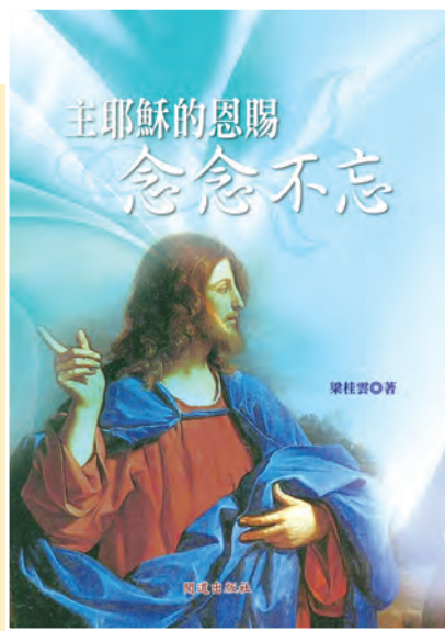
▲《主耶穌的恩賜念念不忘》是一位平信徒的奉獻事主及靈修生活分享，值得品讀。

是的，《主耶穌的恩賜念念不忘》。從對原鄉的想像及思念，來到中國東南沿岸邊的小島台灣，歷經爸爸離世，在台灣成長、升學、就業、結婚、生病及康復，另一半長眠了，她也退休了。人世間的一切，一點一滴，慢慢刻畫，慢慢累積，慢慢成形。這個強韌生命力的核心來自哪裡呢？經上說：「那與主結合的，便是與祂成為一神。難道你們不知道，你們的身體是聖神的宮殿，這聖神是你們由天主而得的，住在你們內，